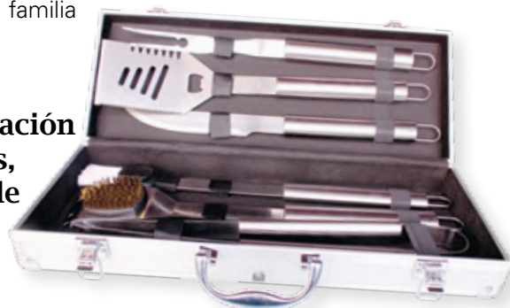
Set de asados Fondecor

Para mayor información sobre inscripciones, fechas y horarios de nuestros eventos, visite siempre: www.fondecor.org