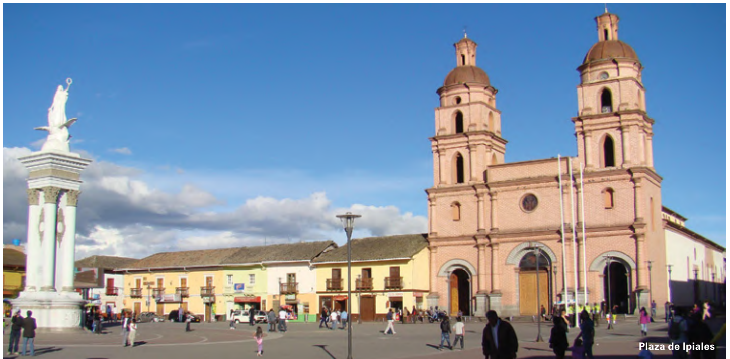
Plaza de Ipiales