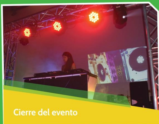
Cierre del evento