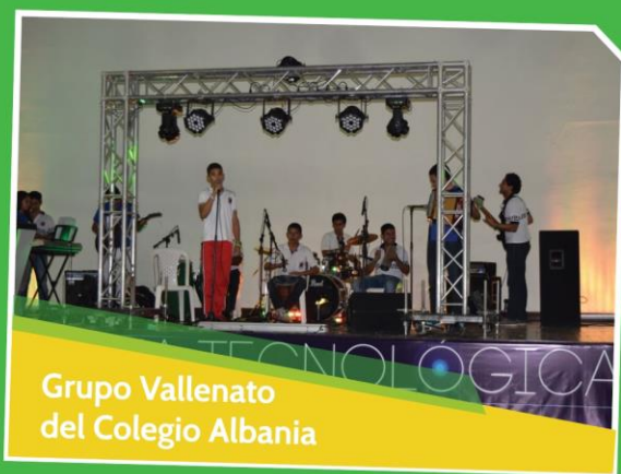
Grupo Vallenato del Colegio Albania

SUPER DESCUENTOS Y PROMOCIONES EN FIN DE AÑO PARA ASOCIADOS A FONDECOR