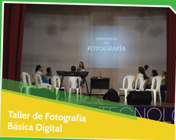
Taller de Fotografía Básica Digital

Agradecemos a todos los asociados su participación y esperamos que muchos más nos acompañen en las próximas versiones de la feria.